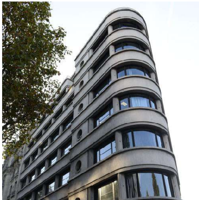
Siège de la DGAFP (Paris-Austerlitz)

Le gouvernement s'entête à maltraiter les personnels de la fonction publique, la FSU s'entête à les défendre !